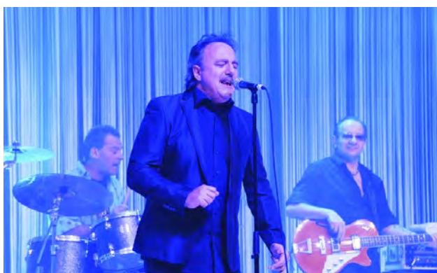
Opus bei ihrem stimmungsvollen Live-Auftritt