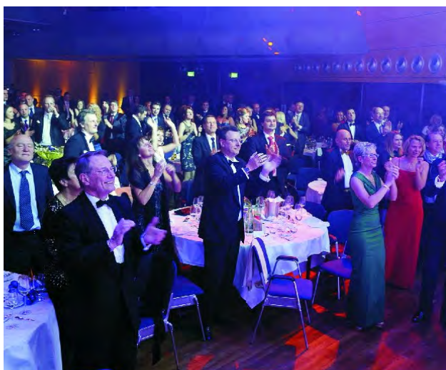
...die Gäste gingen bei den Hits von Opus begeistert mit