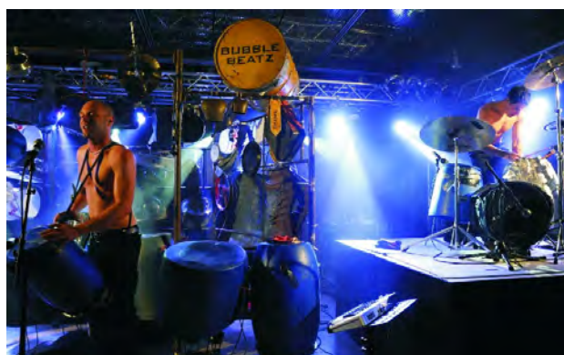
Bubble Beatz mit ihrer spektakulären Show